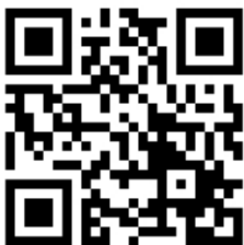
大会 A 申込 QR コード

【申込先】 〒363-8509 埼玉県桶川市赤堀2-4 マルキュー(株)内 MFG本部事務局 TEL 048-728-0909 / FAX 048-728-3909 問い合わせメールアドレス: info@marukyufangroup.com