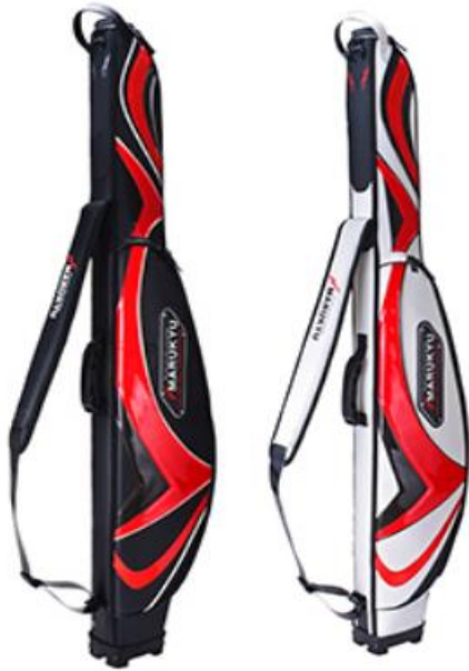
リールinタイプ “ロッドケース”