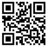
大会申込先QRコード

【申込先】MFG本部事務局 〒363-8509 埼玉県桶川市赤堀2-4 マルキュー(株)内 TEL 048-728-0909 / FAX 048-728-3909 問い合わせメールアドレス： info@marukyufangroup.com