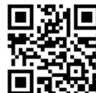
大会申込先QRコード

MFGホームページ：http://www.MarukyuFanGroup.com